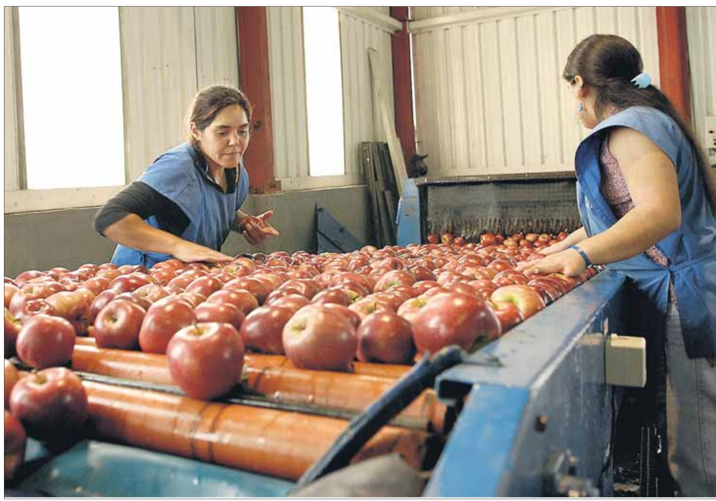
Agrícola-granjero. El sector es uno de los que más limitantes padece para contratar personal en las épocas de cosecha.

En el caso del empleo zafral es muy difícil tomar trabajadores sin formación ni experiencia con la intención de capacitarlos, debido al breve tiempo